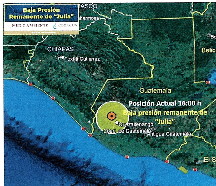
Baja Presión Remanente de "Julia"

Se informa sobre un temporal de lluvias de intensas a torrenciales que afectará los estados del oriente, sureste y Península de Yucatán , generados por la interacción de los remanentes del ciclón tropical "Julia" y un sistema de baja presión ubicado en la Península de Yucatán.